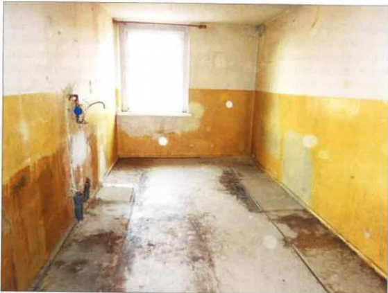
Widok fragmentu kuchni.