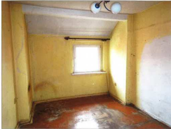
Widok fragmentu pokoju.