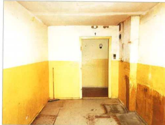
Widok fragmentu kuchni.