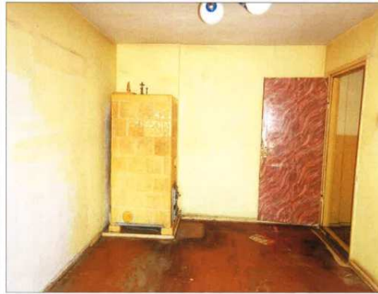
Widok fragmentu pokoju.