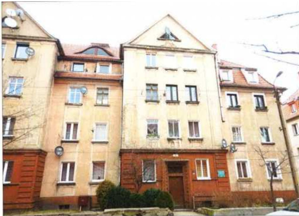
Widok elewacji frontowej– ul. Juliusza Słowackiego nr 15b.

na sprzedaż lokalu mieszkalnego Nr 14 znajdującego się w budynku położonym w Lubaniu przy ul. Juliusza Słowackiego 15a wraz z udziałem we współwłasności nieruchomości gruntowej (działka nr 58/11, AM 14, Obręb I o powierzchni 201 m 2 , JG1L/00020148/5)