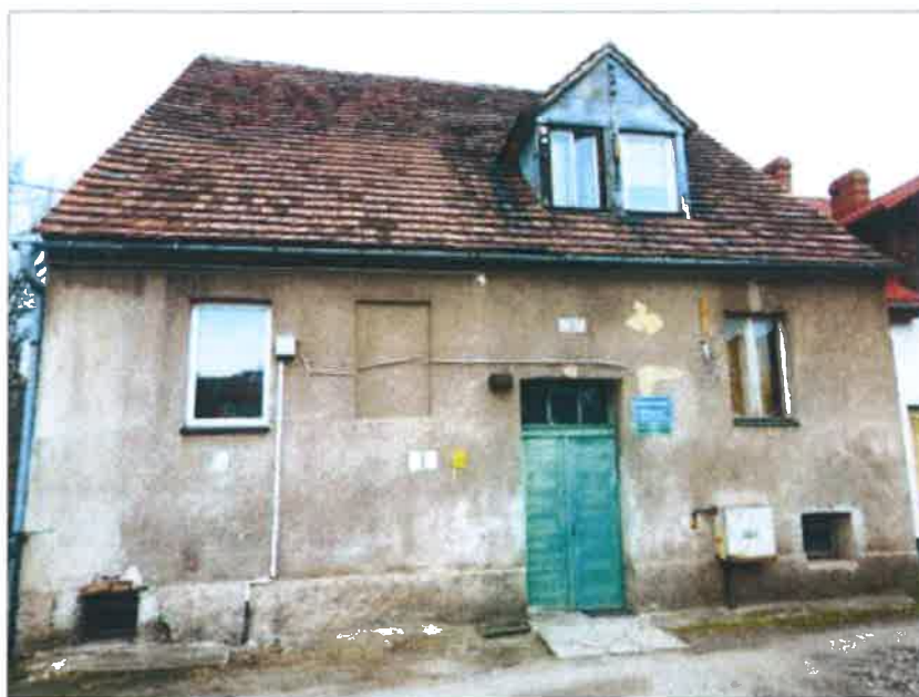
Widok elewacji frontowej – ul. Włókiennicza nr 5a.

na sprzedaż lokalu mieszkalnego Nr 3 znajdującego się w budynku położonym w Lubaniu przy ul. Włókienniczej 5a wraz z udziałem we współwłasności nieruchomości gruntowej (działka nr 57/13, AM 18, Obręb II o powierzchni 478 m 2 , JG1L/00028431/2)