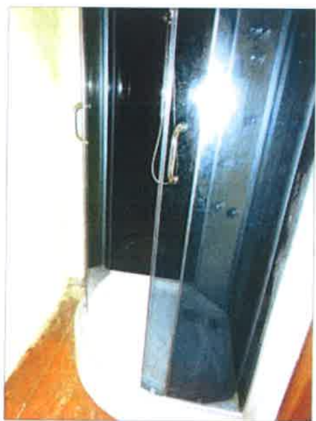
Widok fragmentu łazienki z wc