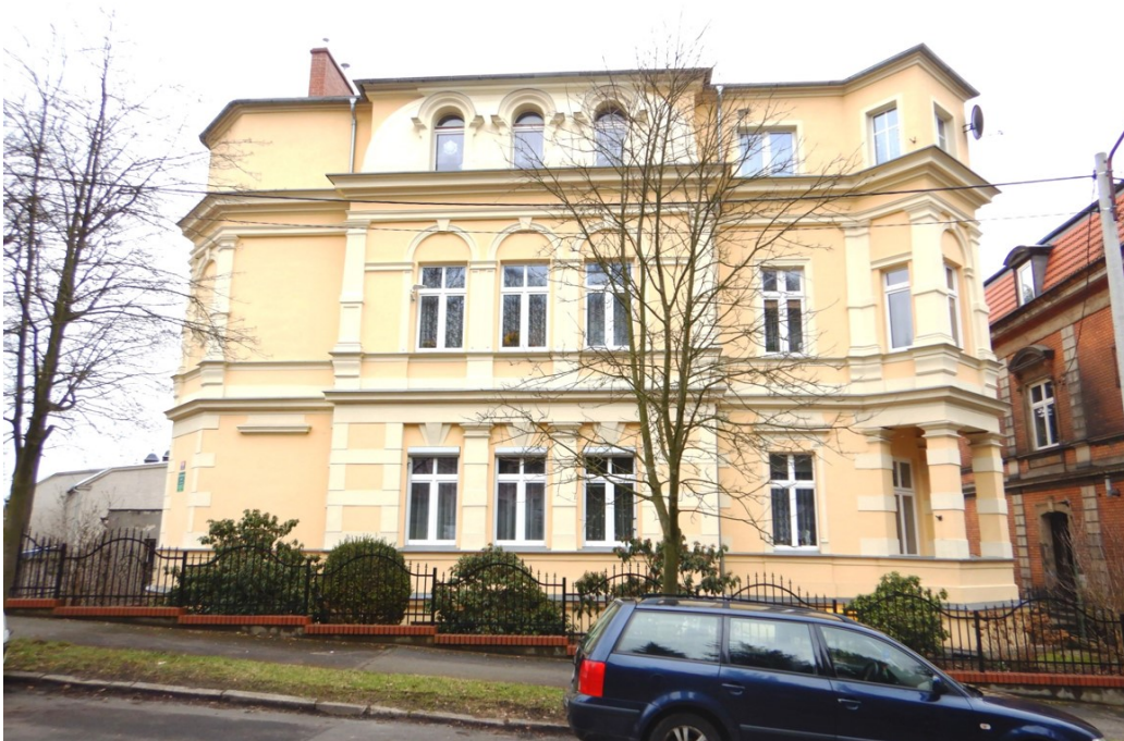
Ogólny widok budynku

na sprzedaż lokalu mieszkalnego Nr 7 znajdującego się w budynku położonym w Lubaniu przy ul. Górnej 9 wraz z udziałem we współwłasności nieruchomości gruntowej (działka nr 49, AM 6, Obręb V o powierzchni 238 m 2 , JG1L/00016050/0)